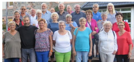
Eine 19-köpfige Gruppe des ungarisch-deutschen Freundeskreises Mohács-Bensheim weilte zum Winzerfest 2022 in Bensheim. Unser Bild entstand vor dem Bensheimer Rathaus.

Wenn wir Ihr Interesse zu unserem Freundeskreis und unserer ungarischen Partnerstadt Mohács geweckt haben, rufen Sie uns doch ganz einfach an oder werden Sie Mitglied im deutsch-ungarischen Freundeskreis Bensheim-Mohács.