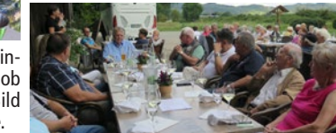
Halbtagsausflug mit Weinprobe im Weingut Lulay-Koob in Heppenheim. Unser Bild zeigt einen Teil der Gruppe.