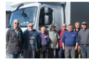
Insgesamt 37 Hilfstransporte gingen seit der Verschwisterung 1987 mit der ungarischen Stadt Mohács von Bensheim aus in die Partnergemeinde. Unser Bild zeigt die fleißigen Helfer, die tonnenweise, Jahr für Jahr, die Lkw beladen, bevor sie die rund 1200 Kilometer lange Reise in die südungarische Stadt Mohács antraten.